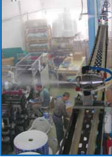
Spray master'ın matbaada kullanımı