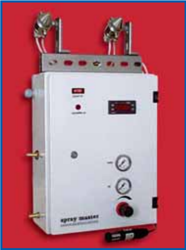
Dijital higrostatlı otomatik kontrol panosu