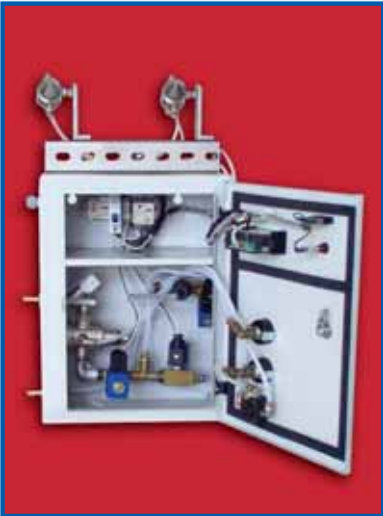
Kontrol panosunun iç görünümü