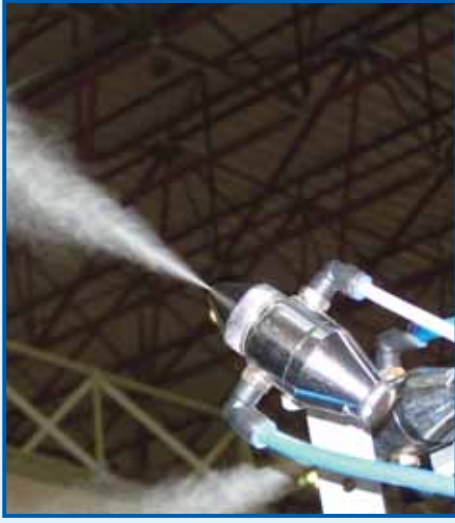
İleri teknoloji ürünü spray master nozul